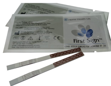
Test de droga individual

Estos le daran un resultado positivo para opiáceos. Sería aconsejable preguntar a la persona que está siendo probado si utiliza cualquier medicamento recetado para uso médico antes de la prueba se lleva a cabo.