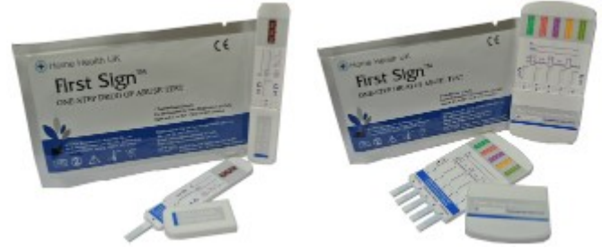
Test de Droga individual

Sería aconsejable preguntar a la persona que está siendo probado si utiliza cualquier medicamento recetado para uso médico antes de la prueba se lleva a cabo.