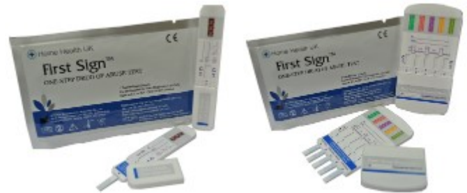
Test de Droga Sencillo

Sería aconsejable preguntar a la persona que está siendo probado si utiliza cualquier medicamento recetado para uso médico antes de la prueba se lleva a cabo.